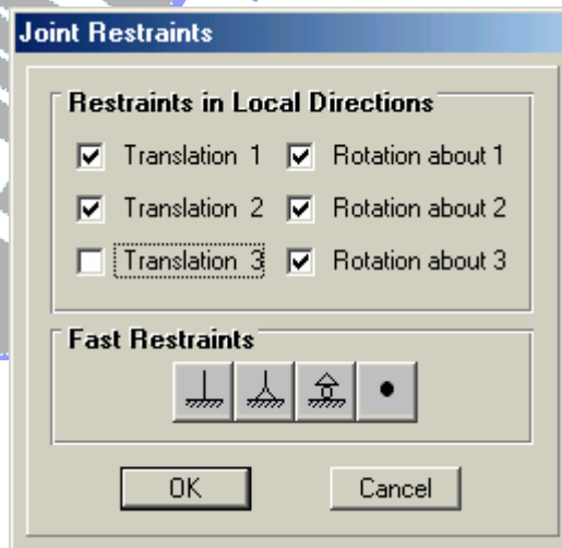
( شكل 8- 13 )